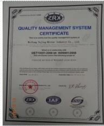
ISO 9001 Certificate