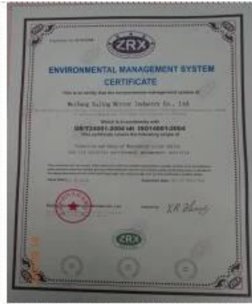
ISO 14001 Certificate