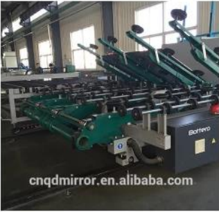
Automatic Glass Cutting Line