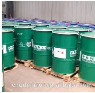
Raw Material: Italy FENZI Paint