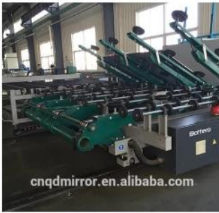
Automatic Glass Cutting Line