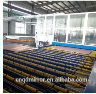
Mirror Production Line