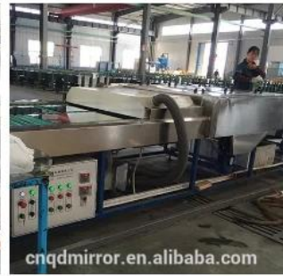
Glass and Mirror Cleaning Line