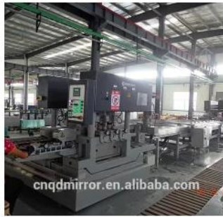
Automatic Glass Edging Line