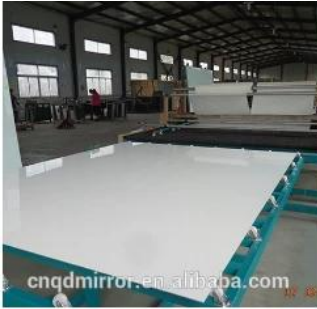
Film Covering Line (CAT I&II)