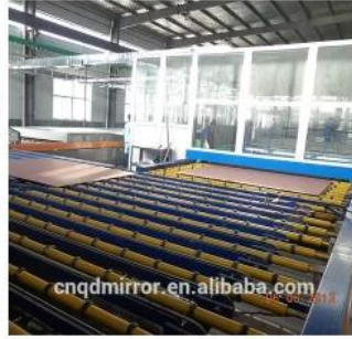
Mirror Production Line