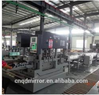
Automatic Glass Edging Line