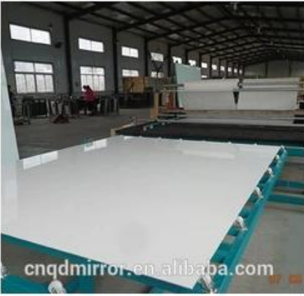
Film Covering Line (CAT I&II)