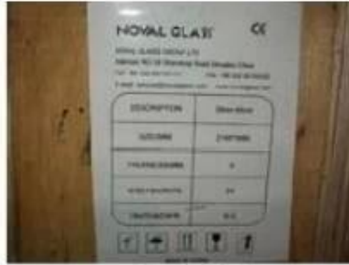
Note on crates