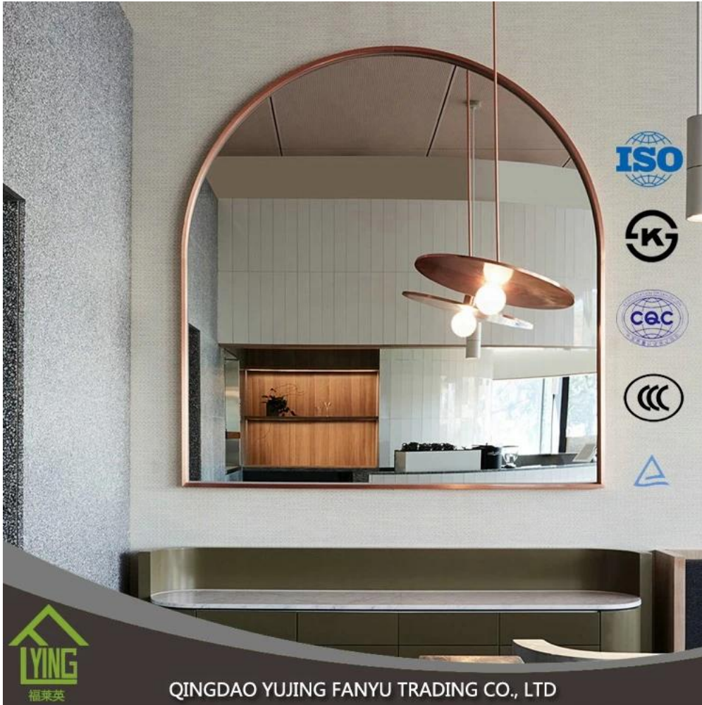
QINGDAO YUJING FANYU TRADING CO., LTD

本公司按照 ISO 9001:2000 质量管理体系标准的要求，建立了质量管理体系，并通过了 ISO 9001:2000 质量管理体系认证。本公司质量管理体系覆盖本公司所有生产、销售和服务过程。本公司质量管理体系的有效性得到了认证机构的认可。本公司质量管理体系的有效性得到了认证机构的认可。