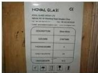
Note on crates