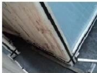
Bottom of crates