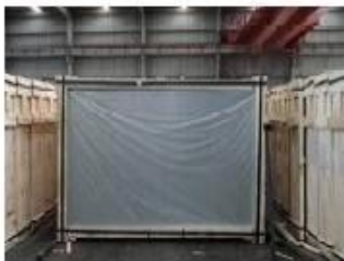
Front of crates