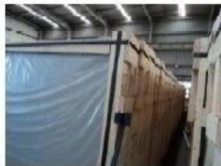
Top of crates