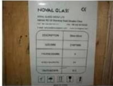
Note on crates