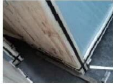
Bottom of crates