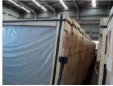
Top of crates