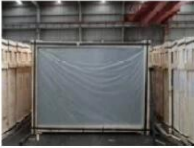
Front of crates