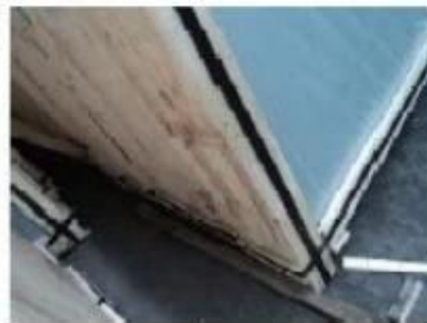
Bottom of crates