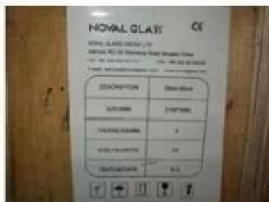
Note on crates