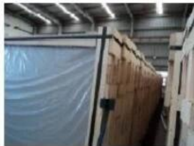
Top of crates