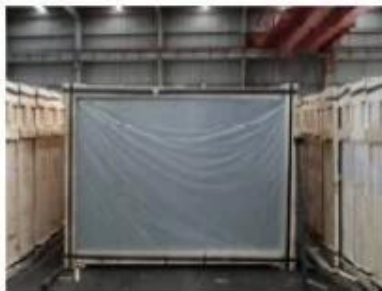
Front of crates