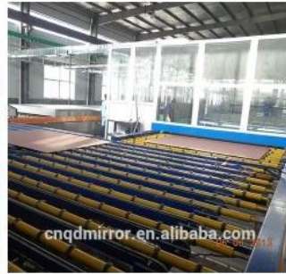
Mirror Production Line