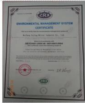
ISO 14001 Certificate