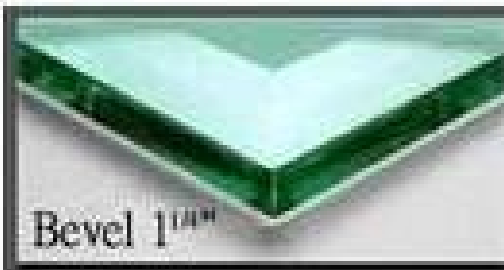
Bevel 1 mm