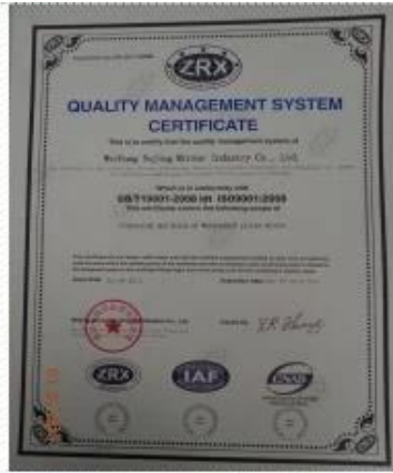
ISO 9001 Certificate