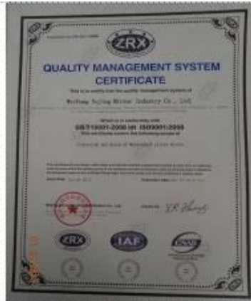
ISO 9001 Certificate