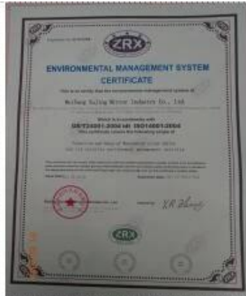
ISO 14001 Certificate