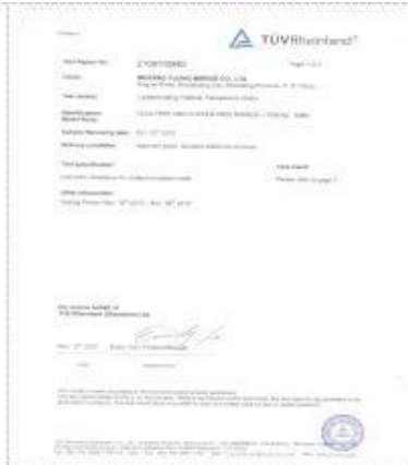
TUV CASS test report I