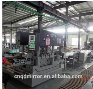
Automatic Glass Edging Line