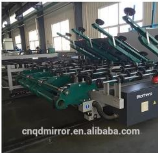
Automatic Glass Cutting Line