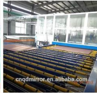
Mirror Production Line