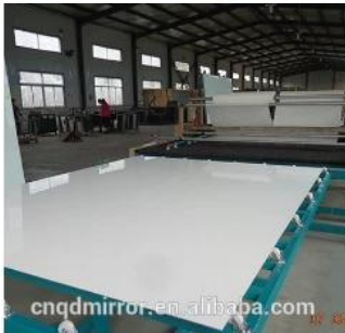
Film Covering Line (CAT I&II)