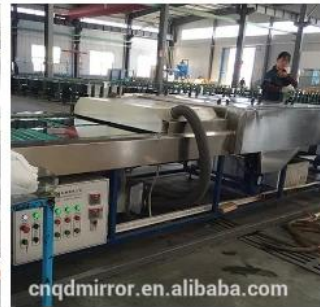
Glass and Mirror Cleaning Line