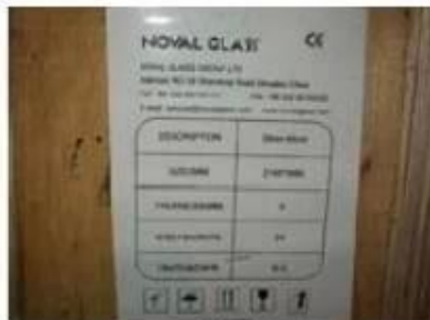
Note on crates