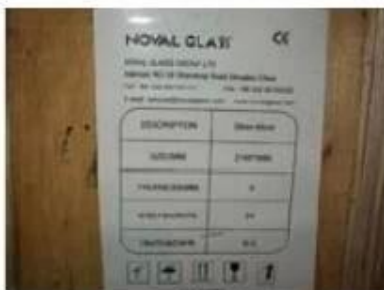
Note on crates