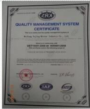
ISO 9001 Certificate