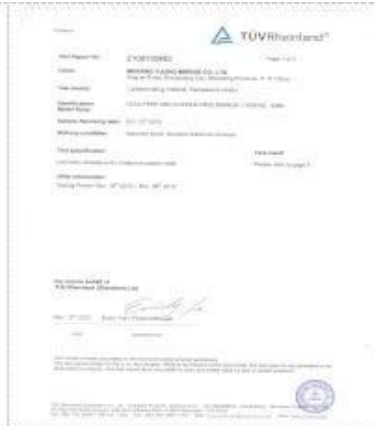
TUV CASS test report I