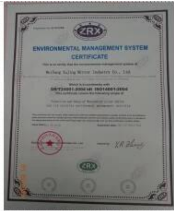
ISO 14001 Certificate