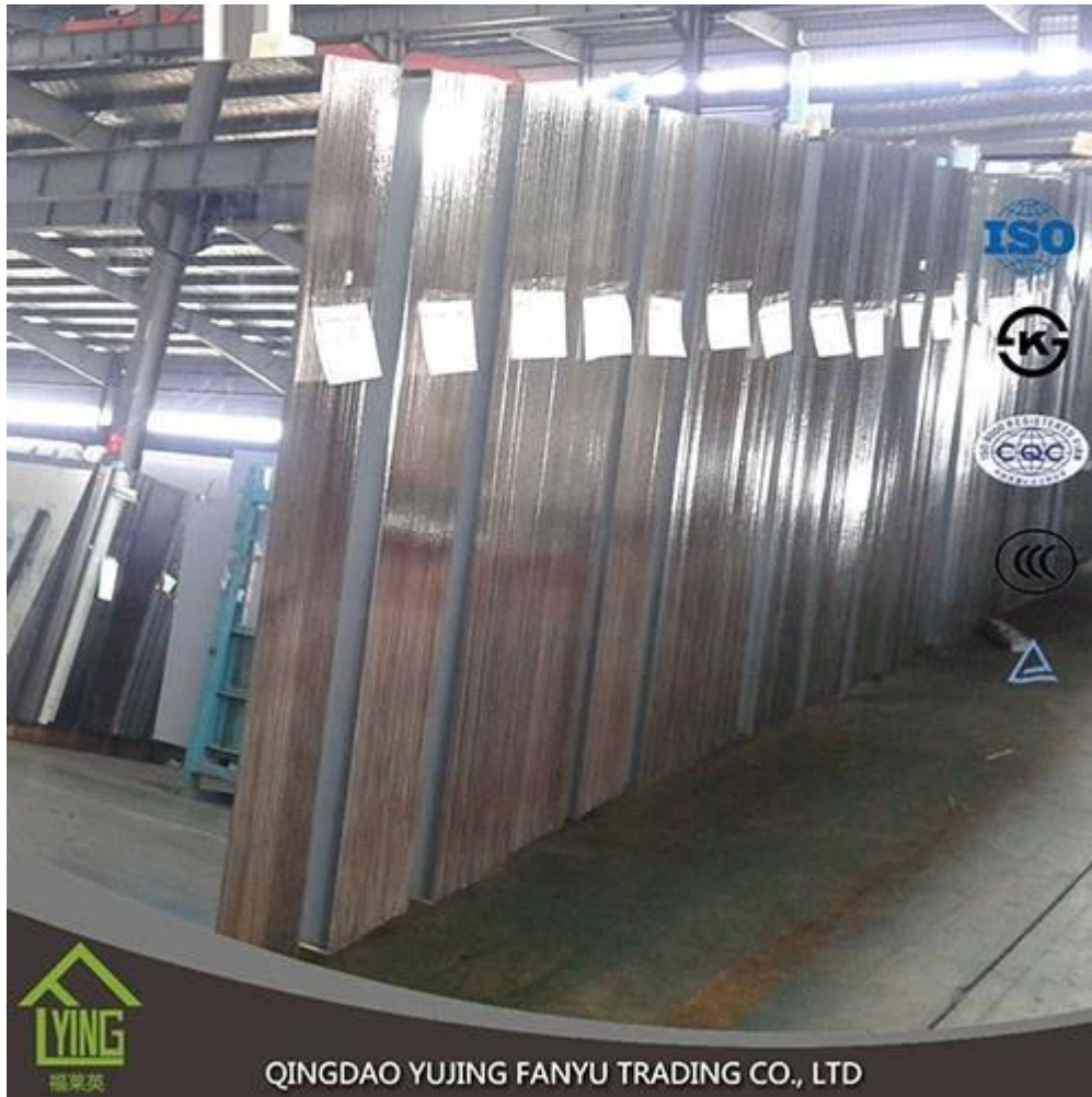
QINGDAO YUJING FANYU TRADING CO., LTD