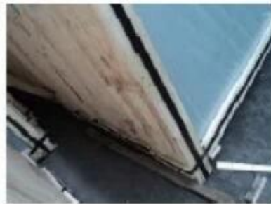
Bottom of crates