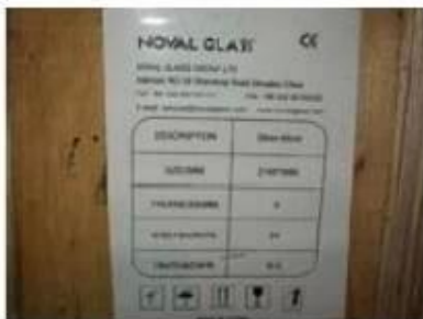
Note on crates