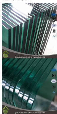
Curvo in vetro temperato per sboccia porta:

• Straight bordi lucidati • Trattamento di bordi con macchina automatica • Ciliati con tagliatura del getto di acqua