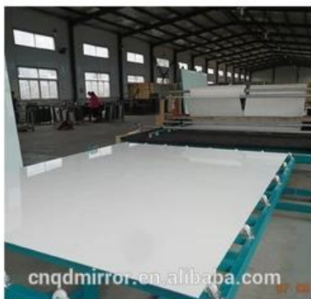
Film Covering Line (CAT I&II)