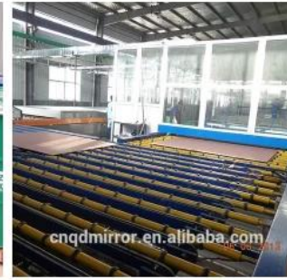
Mirror Production Line