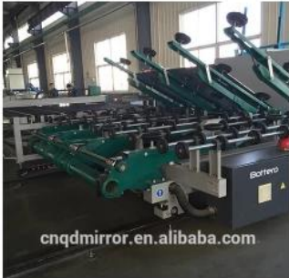
Automatic Glass Cutting Line