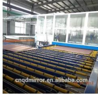
Mirror Production Line