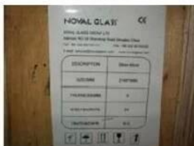
Note on crates