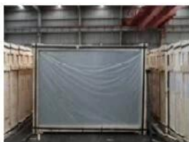
Front of crates