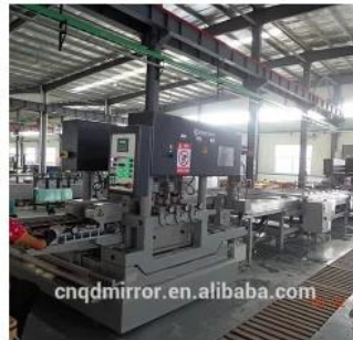
Automatic Glass Edging Line