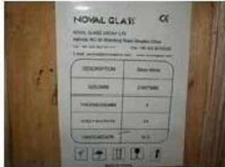
Note on crates