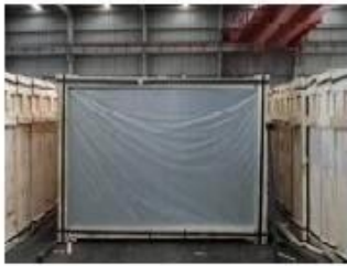
Front of crates