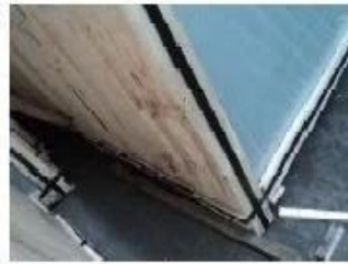
Bottom of crates