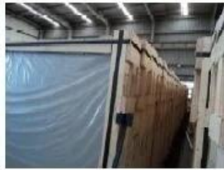
Top of crates