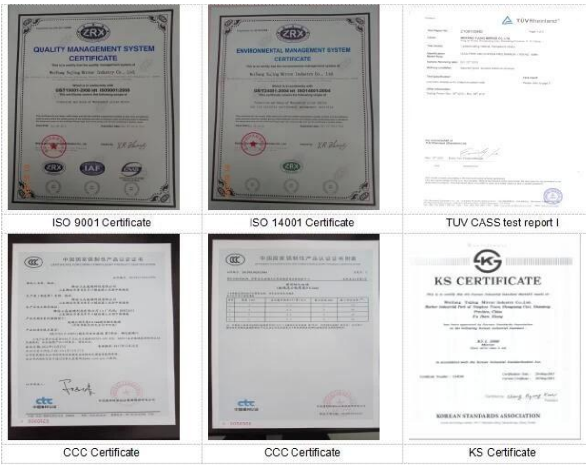
ISO 9001 Certificate