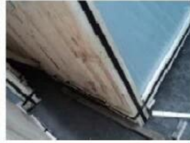
Bottom of crates