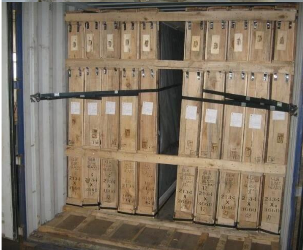
Detalhes de empacotamento: