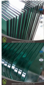
Vidro curvo temperado para porta de chuveiro