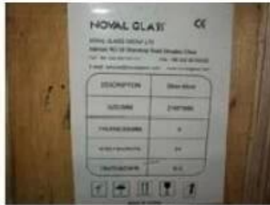
Note on crates