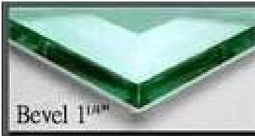
Bevel 1 mm