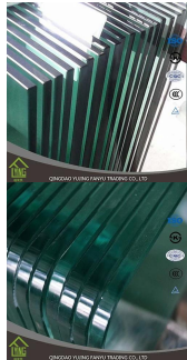
Изогнутое закаленное стекло для дивана